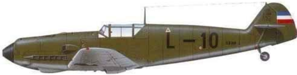
Messerschmitt Me-109E-3, Jugoslovensko Kraljevsko Ratno.