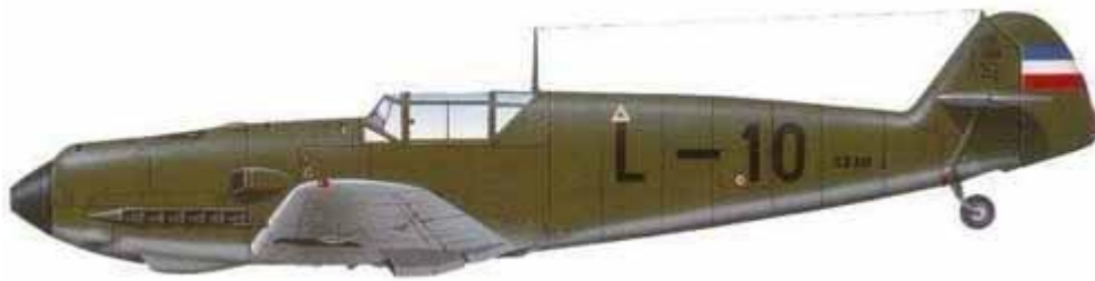
Messerschmitt Me-109E-3, Jugoslovensko Kraljevsko Ratno.