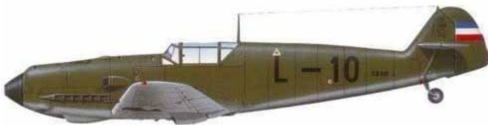
Messerschmitt Me-109E-3, Jugoslovensko Kraljevsko Ratno.