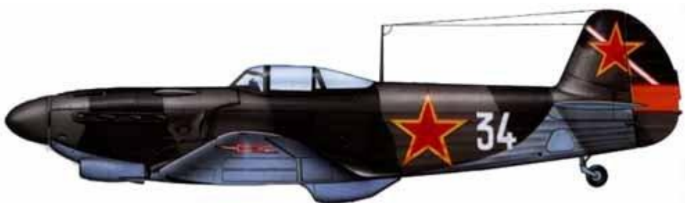
Yakovlev Yak-1, 113 Fighter Regiment, 11. Fighter Division, únor 1945 .