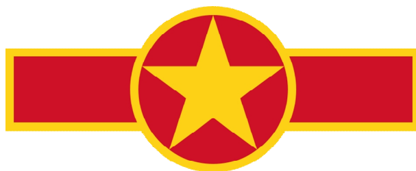
výsostné značení vietnamského vojenského letectva