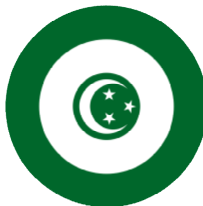
výsostné značení egyptského vojenského letectva