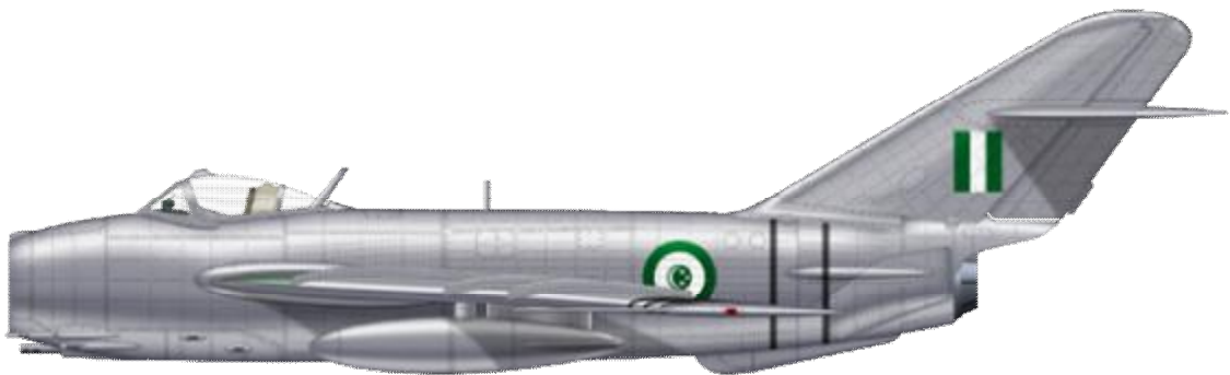
Mikojan-Gurjevič MiG-17F, Egyptské vojenské letectvo.