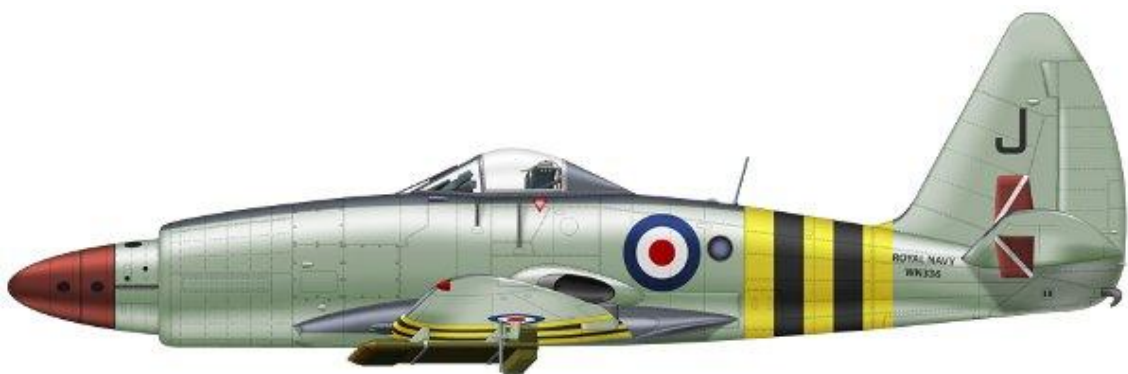
Westland Wyvern S.Mk.4, 830 NAS, FAA, HMS Eagle, 1956.