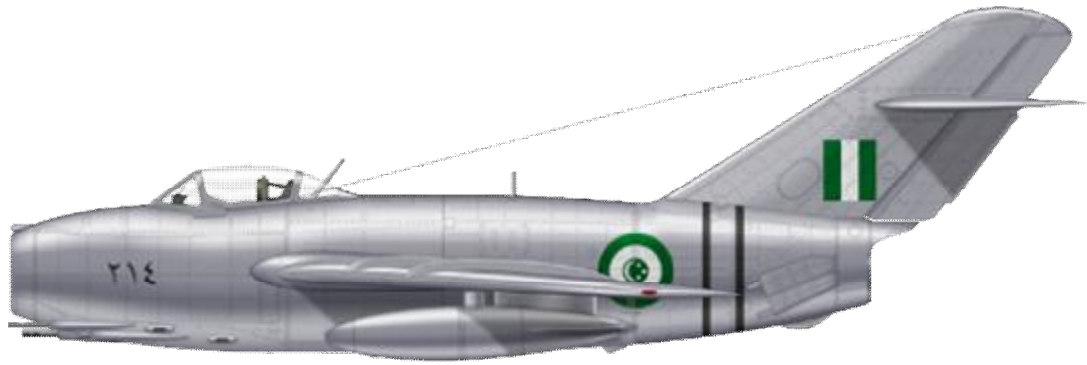
Mikojan-Gurjevič MiG-17F, Egyptské vojenské letectvo.