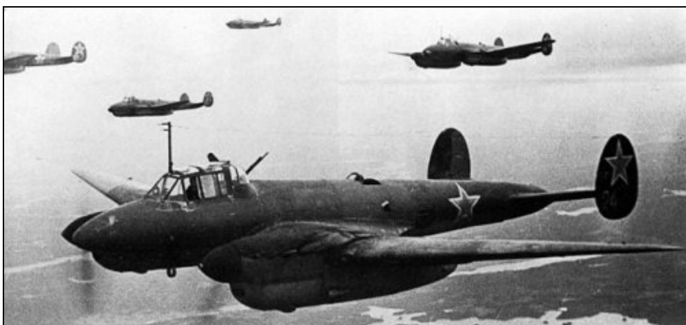
Petljakov Pe-2, stejný typ, se kterým létal 587. ženský denní bombardovací pluk.