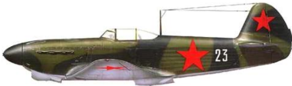
Jakovlev Jak-1B, pilotka Lidia Vladimirovna Litvjaková, 73. GIAP, léto 1943.