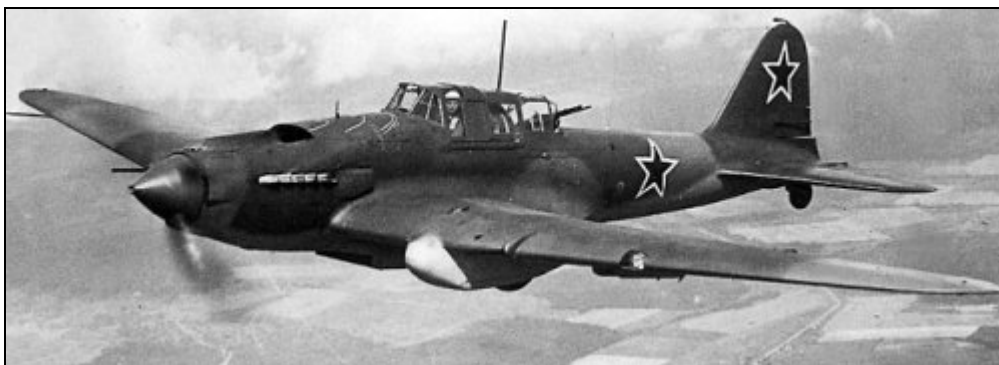
Ilyušin Il-2M3 Šturmovik.