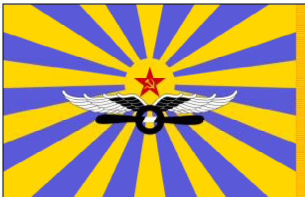
vlajka sovětského vojenského letectva Военно-воздушные силы Советского Союза

AH-1J Bell AH-1 SuperCobra CH-47 Boeing CH-47 Chinook MiG-23MLD Mikojan-Gurjevič MiG-23