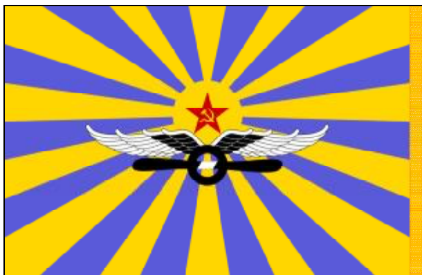
vlajka sovětského vojenského letectva Военно-воздушные силы Советского Союза

AH-1J Bell AH-1 SuperCobra MiG-23MLD Mikojan-Gurjevič MiG-23