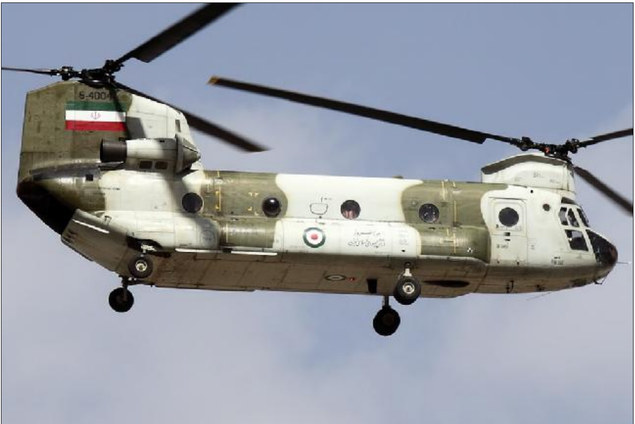
Boeing CH-47 Chinook, Islamic Republic of Iran Air Force نیروی هوایی ارتش جمهوری اسلامی ایران