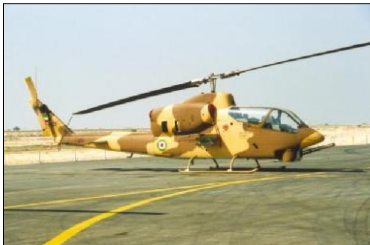
Bell AH-1J SuperCobra, Islamic Republic of Iran Air Force ناریا یمالسایرومچ شترایاوه یورین .