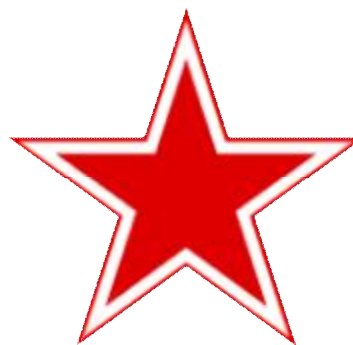
výsostné značení sovětského vojenského letectva