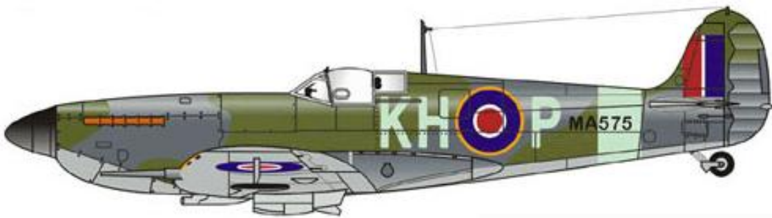
Vickers Supermarine Spitfire Mk.IX, 403 Squadron, 2nd TAF, RCAF.