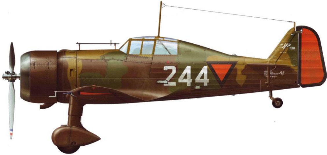
Fokker D.XXII, 1e Ja.V.A.