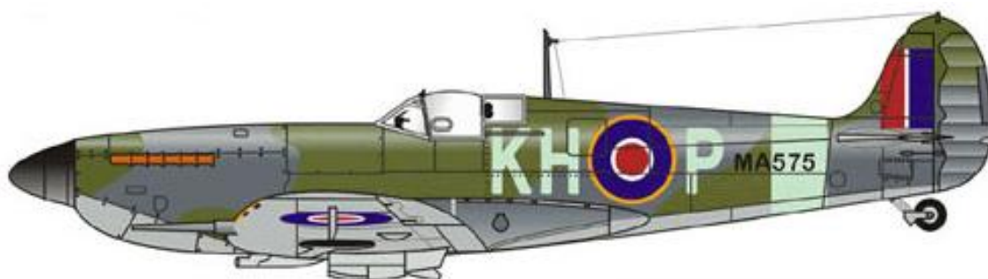
Vickers Supermarine Spitfire Mk.IX, 403 Squadron, 2nd TAF , RCAF .