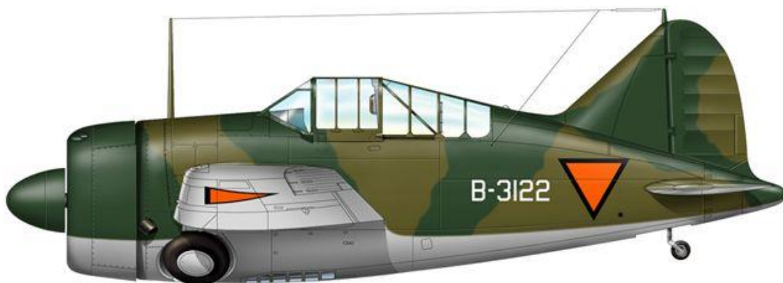
Brewster F2A Buffalo, 3.VIG.V , Netherlands East Indies AF (ML-KNIL).