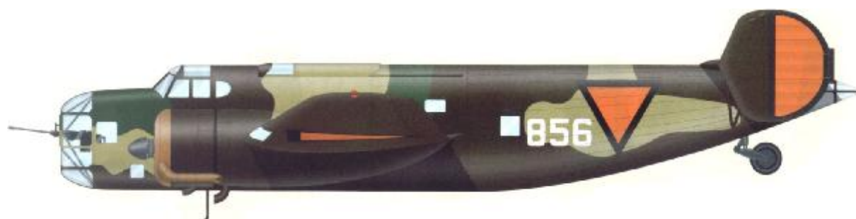
Fokker T.V, Bomb Va.