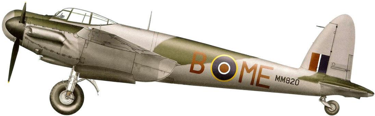
de Havilland Mosquito Mk.30, 488 Squadron, 140 Wing, 2nd Group, 2nd TAF, RAF