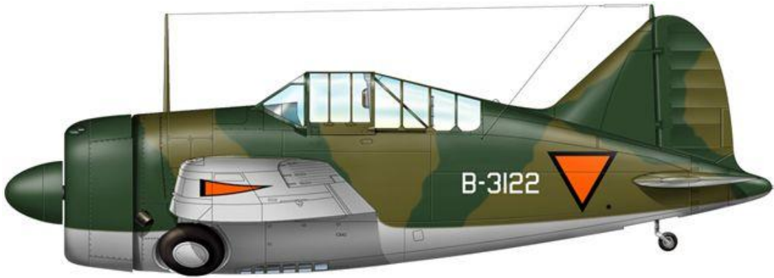
Brewster F2A Buffalo, 3.VIG.V, Netherlands East Indies AF (ML-KNIL).