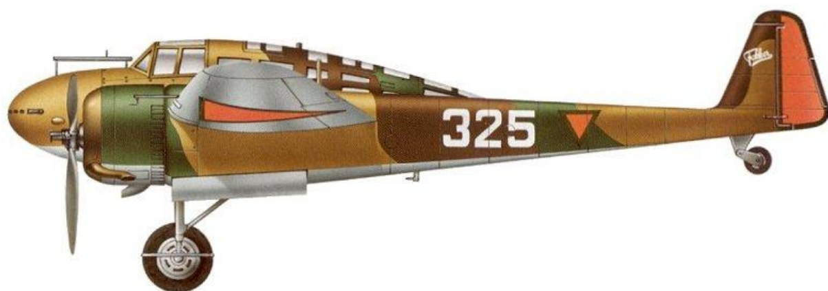
Fokker G.IA, 4 Jachtvliegtuigafdeling