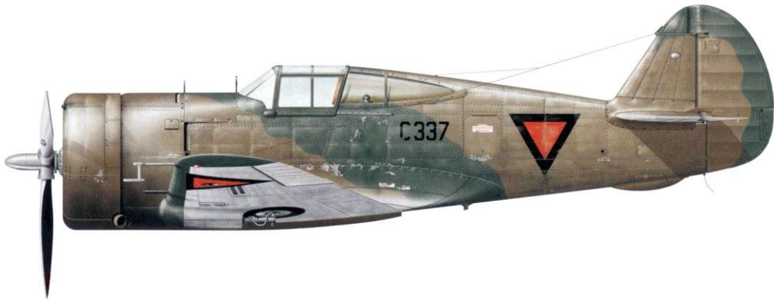
Curtiss Hawk H-75A-7, 1-VIG-IV, Netherlands East Indies AF (ML-KNIL).