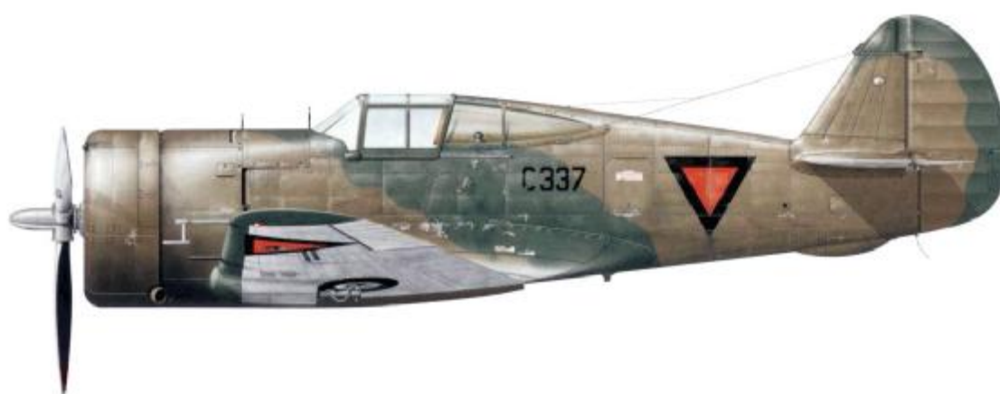
Curtiss Hawk H-75A-7, 1-VIG-IV , Netherlands East Indies AF (ML-KNIL).