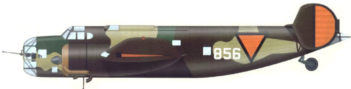
Fokker T.V, Bomb Va.