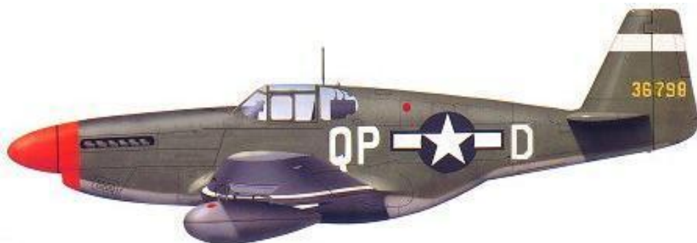
North American P-51B, 43-6798 (QP◦D), No. 334 Fighter Squadron , 2/20/44-3/5/44, pilot Spiros Nikolas Pissanos.