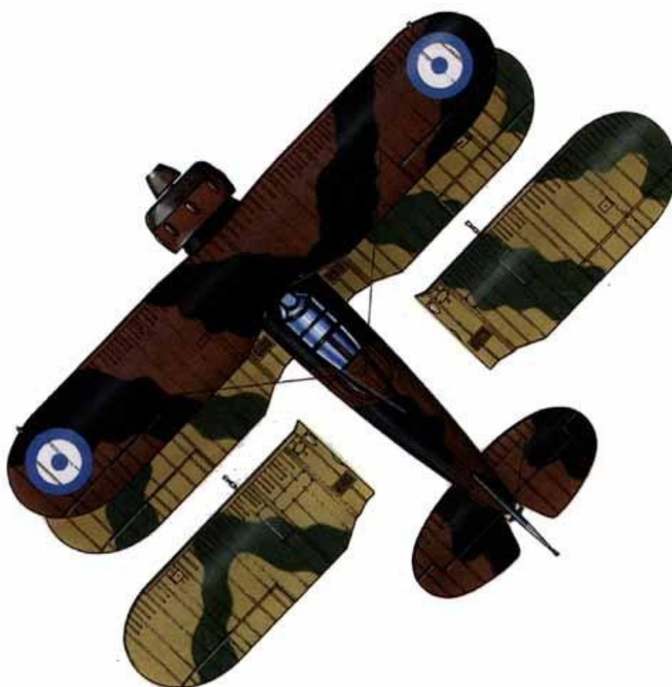
Gloster Gladiator Mk.I "Delta 187", 21. Mira - Elliniki Vassiliki Aeroporia, 1941.