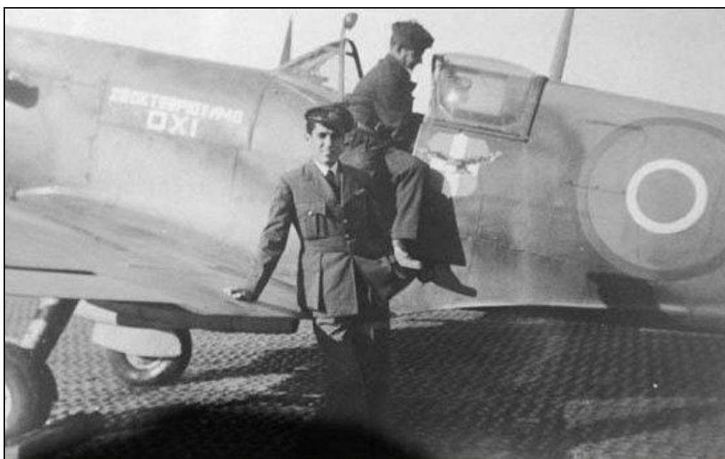
Supermarine Spitfire Mk.VB of 336 Squadron Royal Hellenic Air Force, Itálie, 1944.