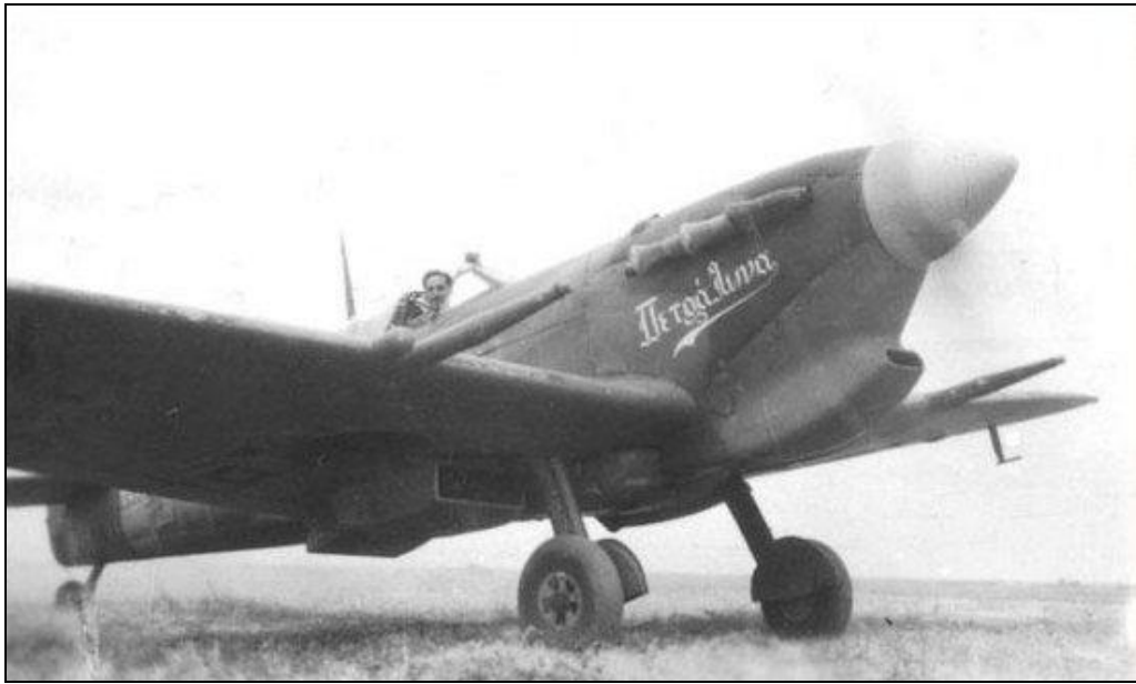
Supermarine Spitfire Mk.VB of 336 Squadron Royal Hellenic Air Force, Severní Afrika , 1944.