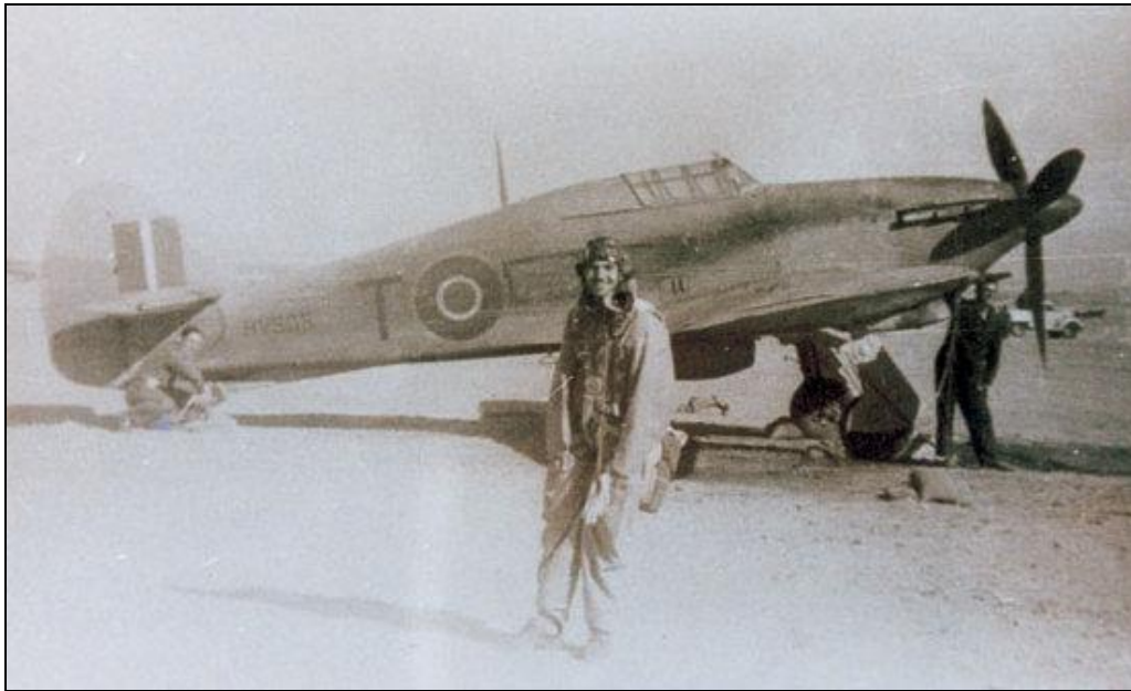
Hawker Hurricane Mk.IIC, 336 Squadron Royal Hellenic Air Force, Western Desert, 1943.