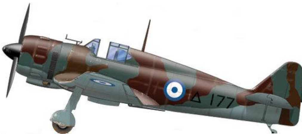
Marcel Bloch MB.151, Elliniki Vassiliki Aeroporia.