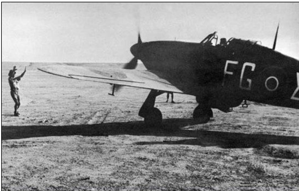
Hawker Hurricane Mk.IIB, 335 Squadron Royal Hellenic Air Force, 1942.