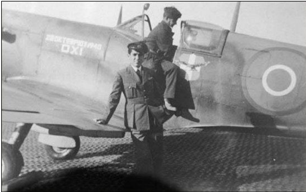
Supermarine Spitfire Mk.VB of 336 Squadron Royal Hellenic Air Force, Itálie, 1944.