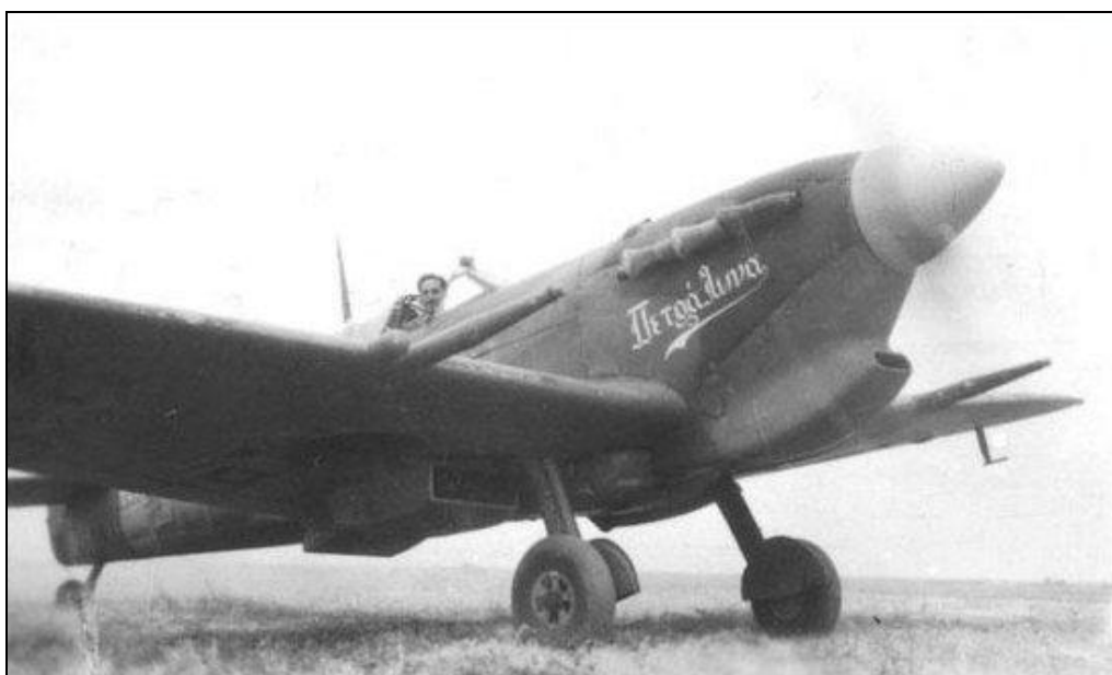
Supermarine Spitfire Mk.VB of 336 Squadron Royal Hellenic Air Force, Severní Afrika , 1944.