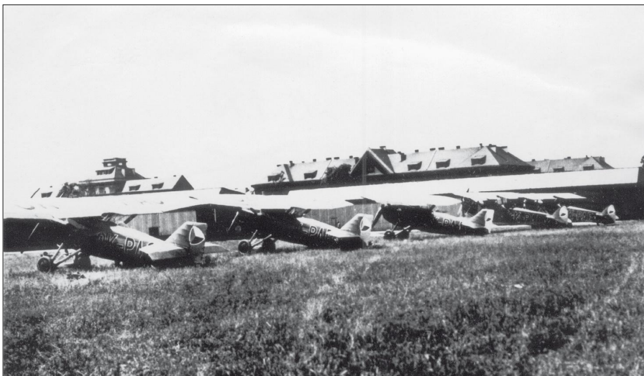
Jedna z prvních fotografií čs. policejního letectva – řada letounů Škoda D.1 na samém počátku existence ČLH v roce 1935.