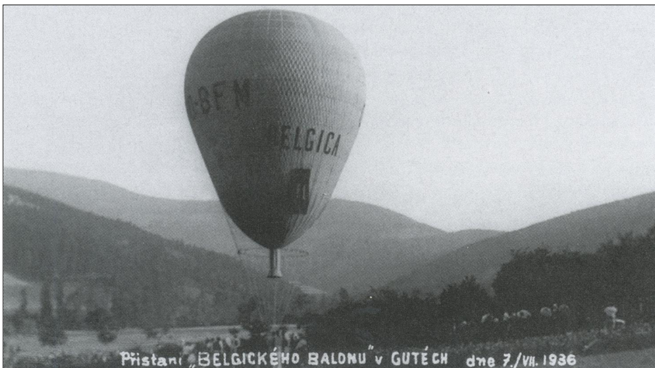
Přistání „BELGICKÉHO BALONU“ v GUTĚCH dne 7./VII. 1936 Belgický balon po přistání v Gutech 7. července 1936 - taková událost stála za zveřejnění na dobové pohlednici.