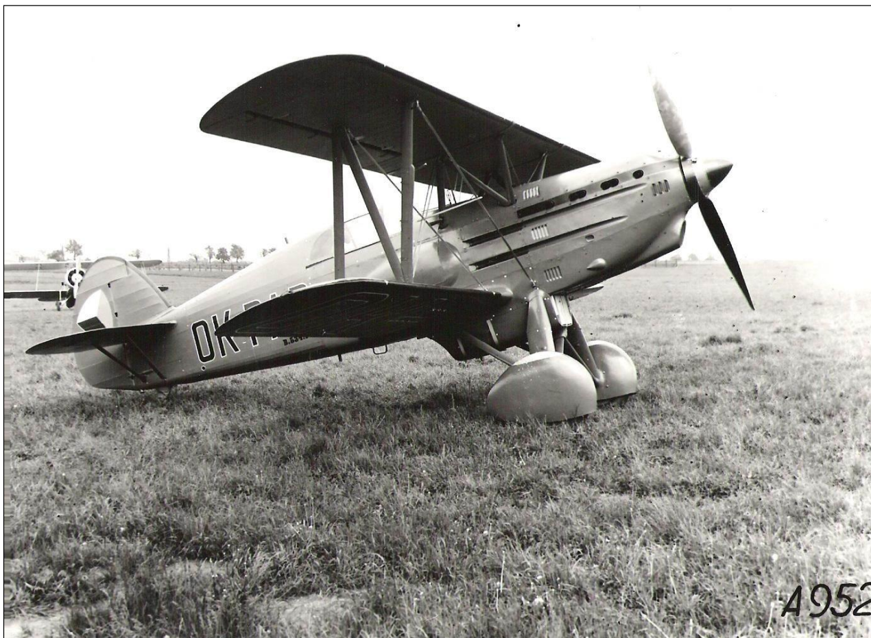
Avia B.534.195, OK-PAR, letoun od 12. 6. 1937 létal u ČLH Hradec Králové.