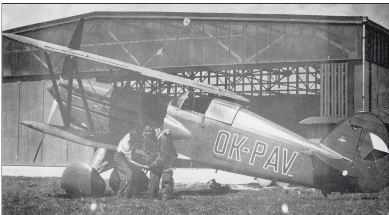
Avia B.534387 OK-PAV. ČLH Moravská ostrava / Německý Brod.