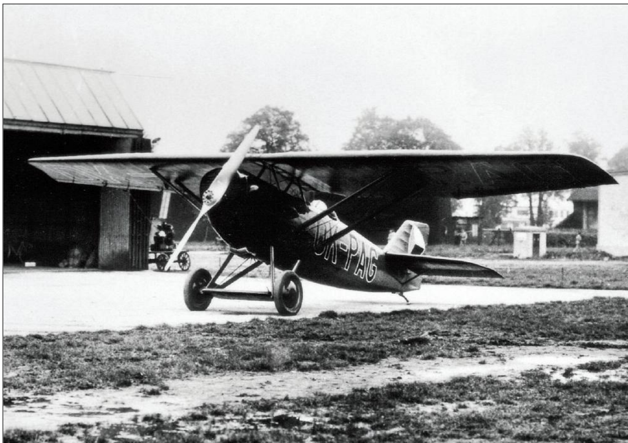
Letouny Škoda D.1 byly prvními stroji Četnických leteckých hlídek.