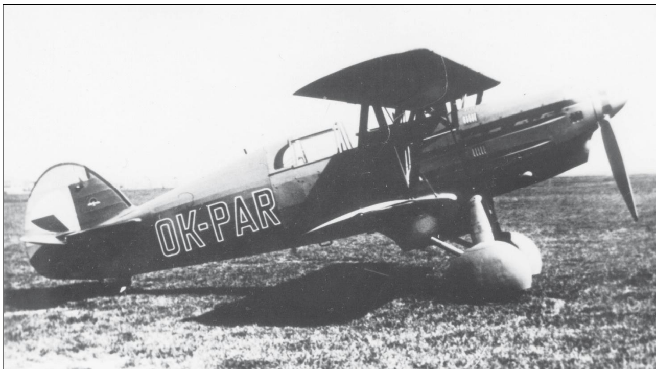
Mezi letouny určené pro provoz ve ztížených povětrnostních podmínkách patřily stroje Avia B.534 IV. série. Zde OK-PAR, kolem roku 1938.