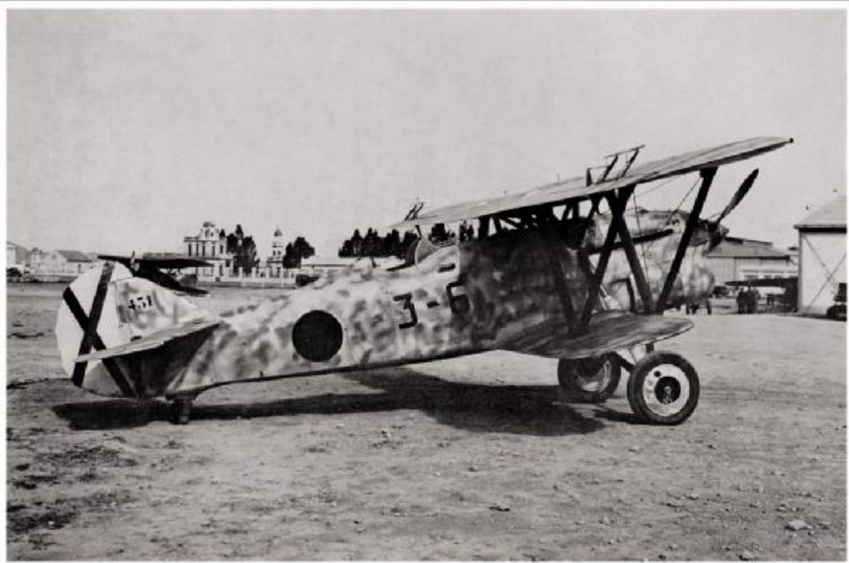
Fiat CR.32, X° Gruppo "Baleari"