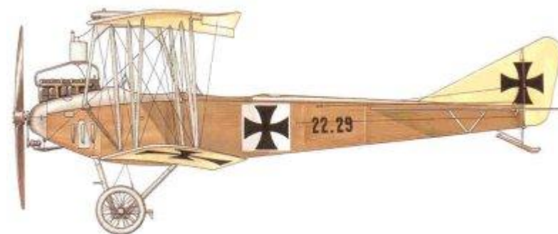
Albatros B.I, 22.29, Hauptmann Otto Jindra, Flik 1, 1915.