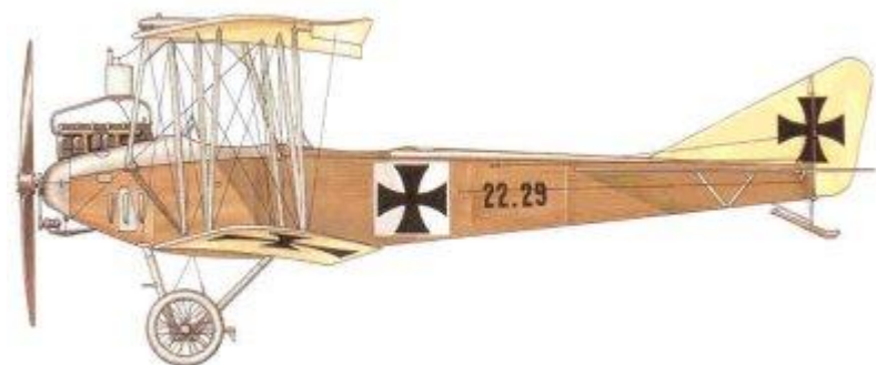
Albatros B.I, 22.29, Hauptmann Otto Jindra, Flik 1, 1915.